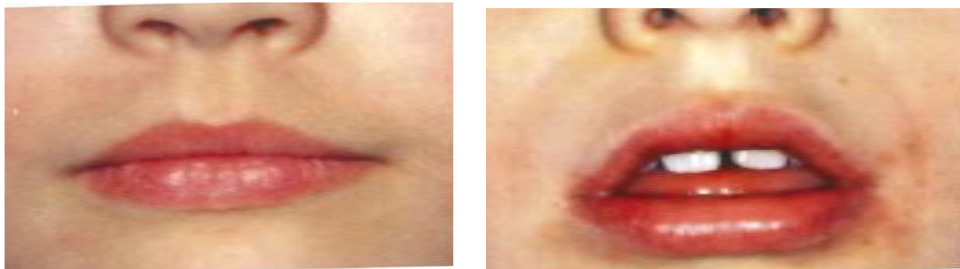
Bilder aus dem Buch „Myofunktionelle Therapie KOMPAKT II“ von M. Furtenbach/I. Adamer

Neben dem gesundheitlichen Aspekt ergibt sich auch ein ästhetischer: